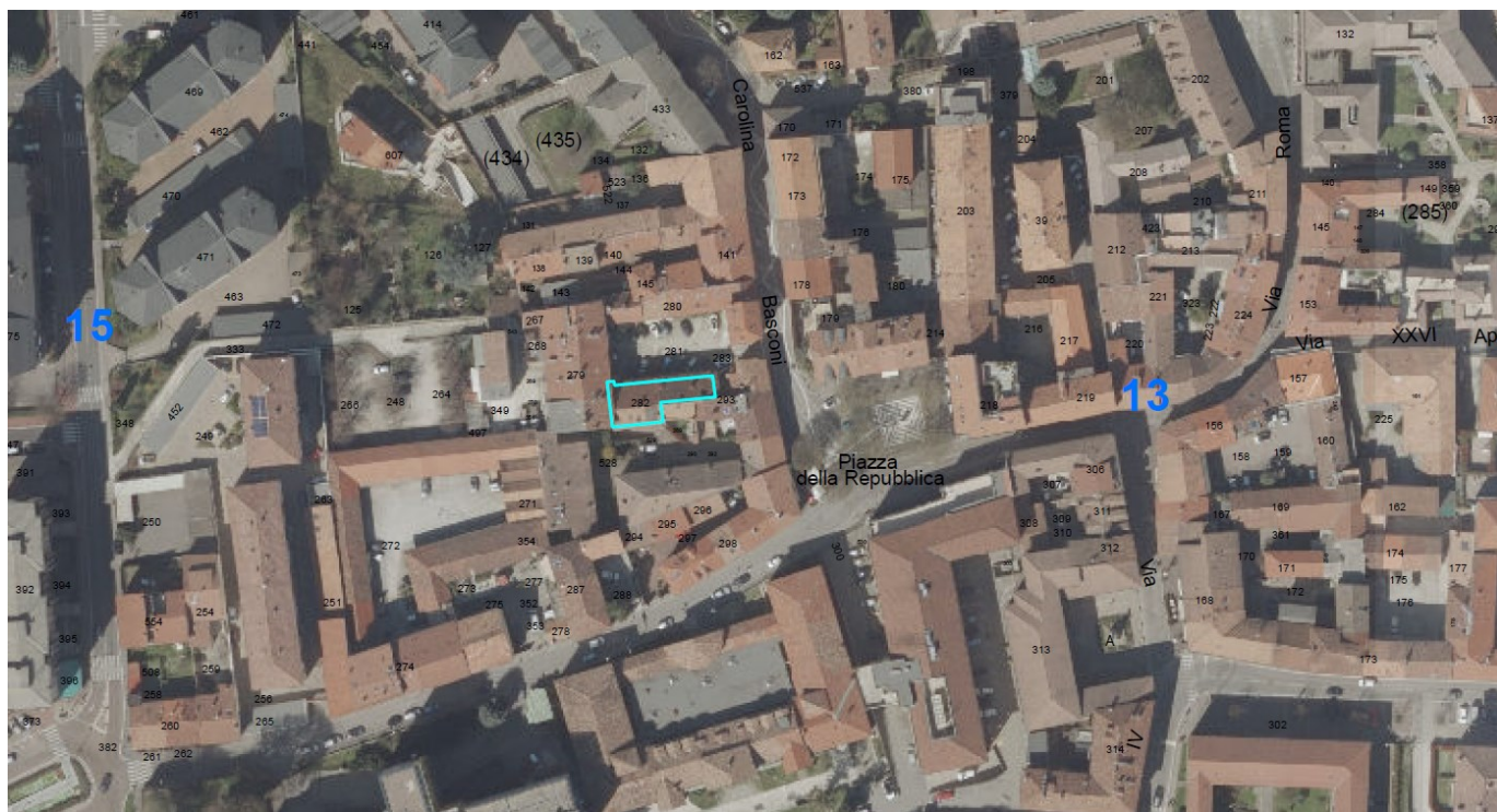
ORTOFOTO – CATASTALE